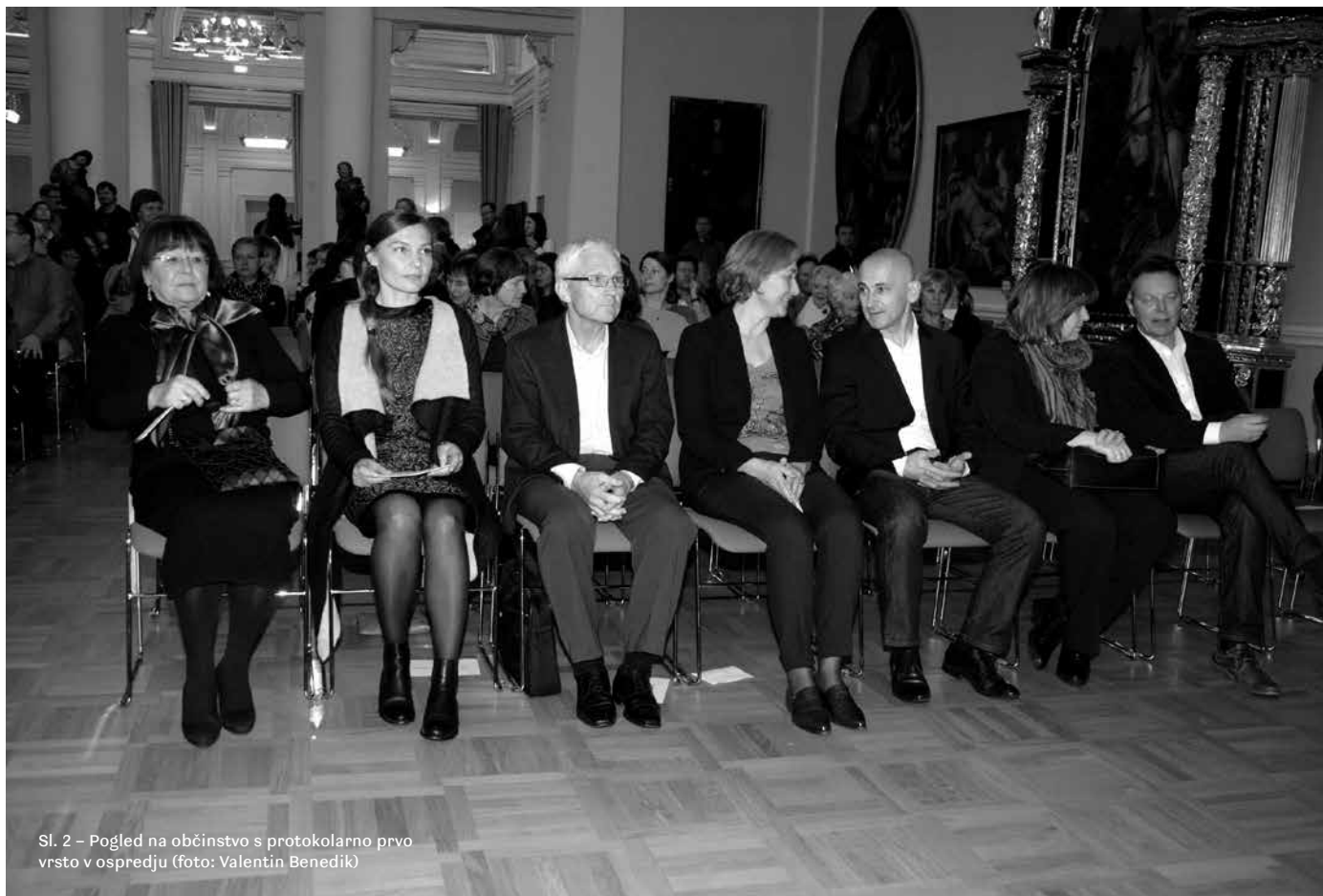
Sl. 2 – Pogled na občinstvo s protokolarno prvo vrsto v ospredju