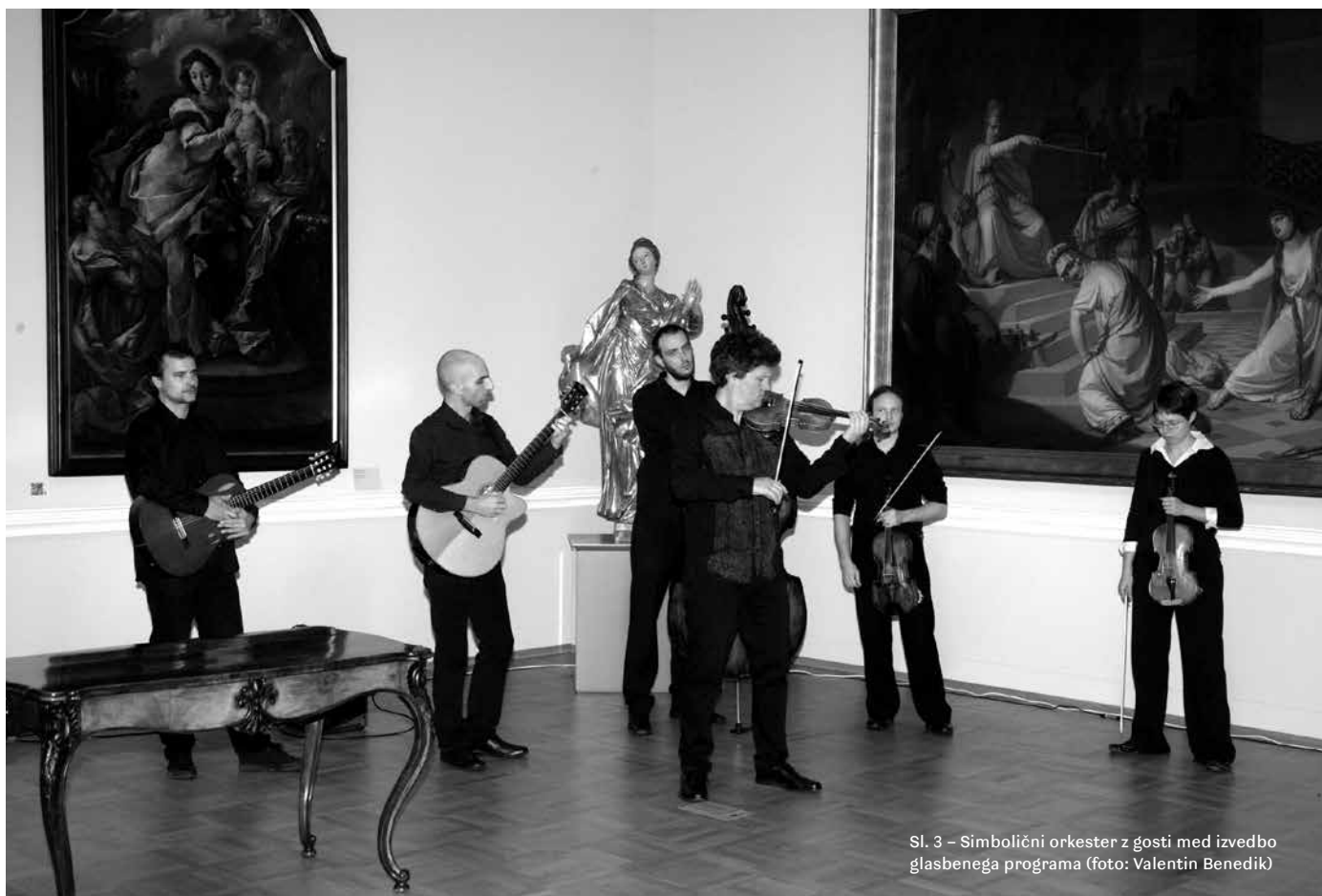
Sl. 3 – Simbolični orkester z gosti med izvedbo glasbenega programa