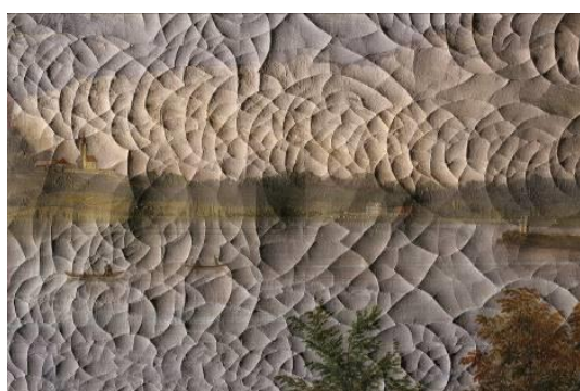
2. Poškodbe slikovnih plasti na sliki M. Pernharta, Bled , NG S 2840, detajl