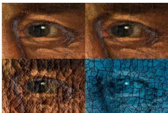
1. Primerjava detajla očesa pri različnih načinih osvetljevanja na sliki F. Berganta, Prestar , NG S 3523