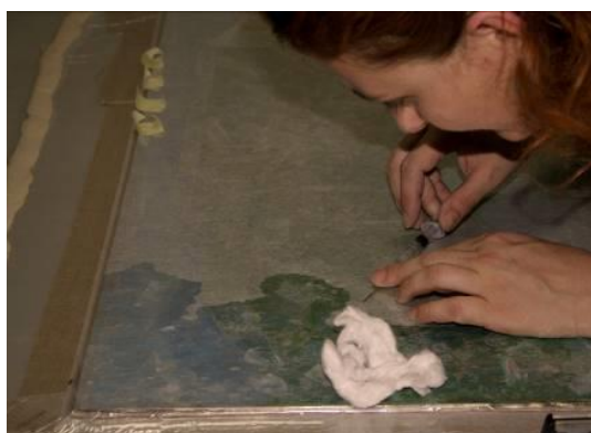
4. Utrjevanje barvne plasti na sliki M. Jama, Krajina z reko , NG S 2370