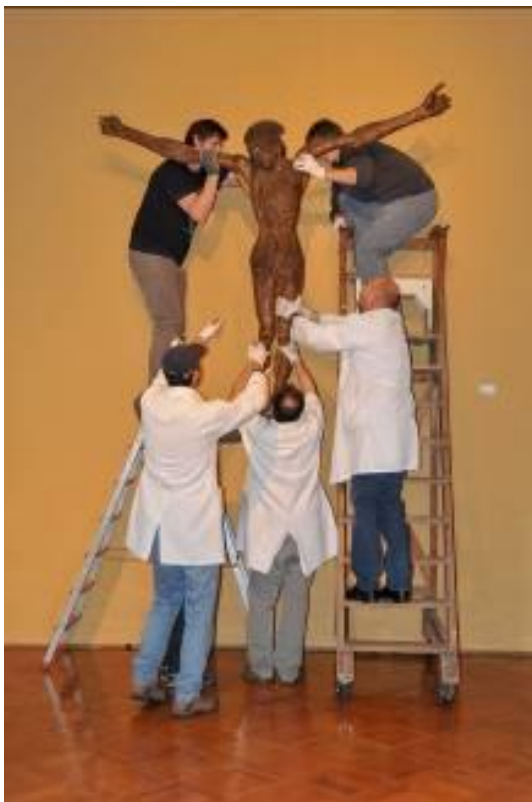
6. Varno rokovanje z lesenim Križanim , NG P 69, neznanega avtorja